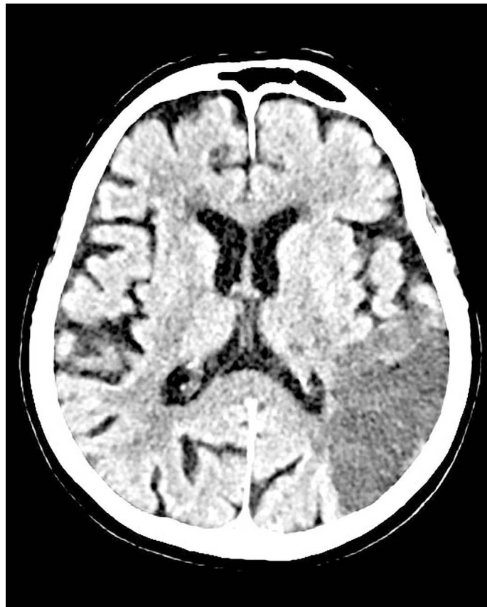
Slika 1: CT glave ob sprejemu je prikazal ishemično področje v levi možganski hemisferi.

Po zaključenem zdravljenju se je mož vrnil v domače okolje, njegova žena je bila za nadaljevanje rehabilitacije premeščena v zdravilišče.