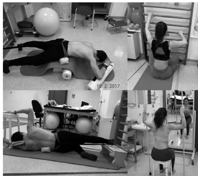
Slika 2: Za skoliozo specifične fizioterapevtske vaje.