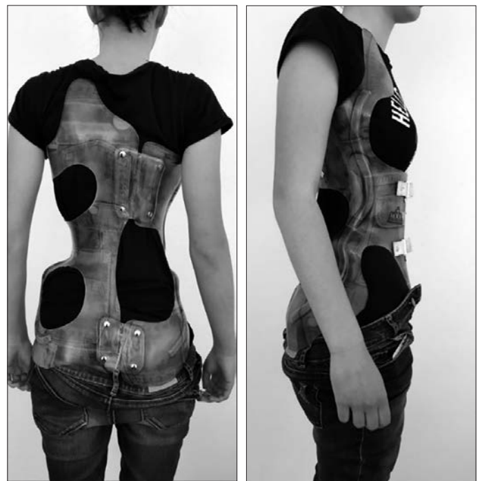
Slika 3: Ortoza za hrbtenico MOOR S.

Znano je, da je pojavnost skolioze med ritmičnimi gimnastičarkami desetkrat višja, višja je tudi pri baletnih plesalkah, vendar dokazov,