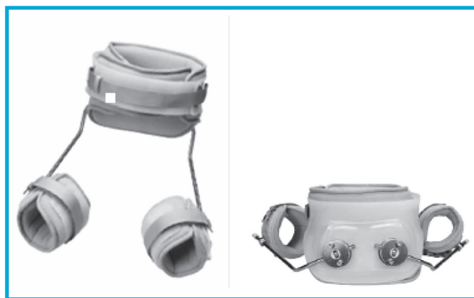
Slika 2: Ortoza SWASH (postavitev pri sedenju in v stoječem položaju) (13)

Sestavni deli ortoze so med seboj povezani prek 21 sklepov, tako da sprememba kota enega dela vpliva na funkcijo preostalih 20 sestavnih delov (13). Sklepi ortoze so nameščeni na hrbtnem delu medenične košare, v bližini sakroiliakalnih