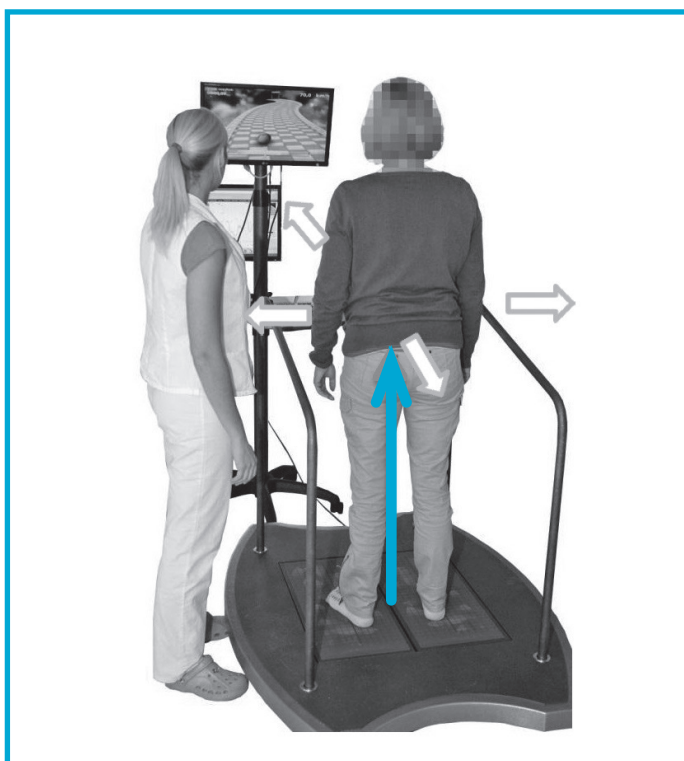
Slika 3: Napravo Gamma sestavljata 2 pritiskovni plošči, ki spremljata potek vertikalne komponente sile ob prenosu teže in informacijo ustrezno posredujejo v obliki premikanja objekta v navideznem okolju.