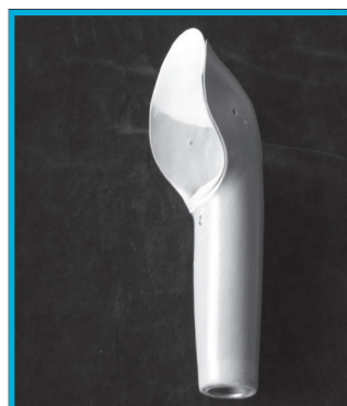
Slika 2: Ležišče z odprtino pod akromionom in z ramensko kapo, izdelano iz silikona.

Silikon je nameščen v predelu ležišča, ki zaradi teže proteze najbolj pritiska na ramo. Tako je ta del ležišča mehkejši in zato udobnejši. Uporaba silikona za delno laminacijo je tehnično zelo zahtevna. Za pritrnitev proteze še vedno potrebujemo pas, ki poteka enako kot pri klasičnem ležišču nadlahtne proteze.