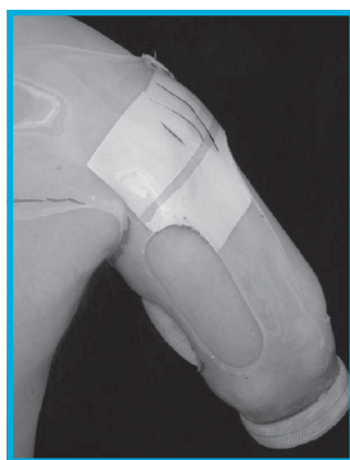
Slika 3: Testno ležišče za ležišče z menjajočimi se področji pritiskov in razbremenitev.

dveh faz. Odvzem mere »klasičnega ležišča« nadlahtne proteze naredi en protetik, za odvzem mere za izdelavo ležišča z menjajočimi se področji pritiskov in razbremenitev pa sta potrebna dva, ki hkrati na štirih različnih mestih pritisneta na krn. Če želi meritev izvesti en protetik, mora imeti posebno napravo za odvzem mere. Poleg tega je potrebno zelo močno pritisniti še v področju obeh kril v predelu rame. Pri obdelavi modela za ležišče z menjajočimi se področji pritiskov in razbremenitev mora protetik na modelu še dodatno poudariti pritiske na mestih izvedenih pritiskov med meritvijo ter oblikovati mehke prehode med mesti pritiskov in razbremenitev. Za obe ležišči smo izdelali testno ležišče (slika 3). Obe dokončni ležišči sta bili laminirani (slika 4).