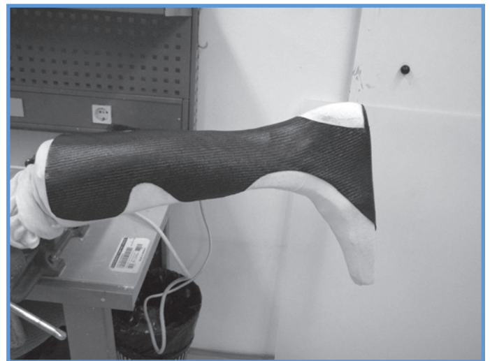
Slika 2: Postopek polaganja in prilaganja plošč iz ogljikovih vlaken.

načrtu in nato s posebnim postopkom prilagodil in oblikoval ortozo (slika 2). Ker smo pričakovali zahtevnejšo obravnavo, je ortotik prej izdelal testno ortozo iz visokotemperaturnih termoplastov.