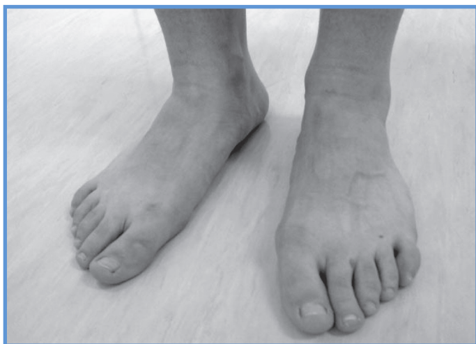
Slika 3: Spuščeni prečni in vzdolžni stopalni loki.

Pri kliničnem pregledu opazujemo bolnika med hojo, stoji, v počepu in v ležečem položaju, ko so njegova kolena pokrčena pod različnimi koti. Ko bolnik stoji in med tem ko hodi, moramo biti pozorni na pronacijo subtalarnega sklepa (valgus petnic), spuščene stopalne loke (slika 3), valgus kolen, morebitne kompenzacijske rotacije golenic in anteverzijo ter notranjo rotacijo kolčnih sklepov, poudarjene krivine hrbtenice ter neenakost dolžine spodnjih udov (2, 3, 12, 14).