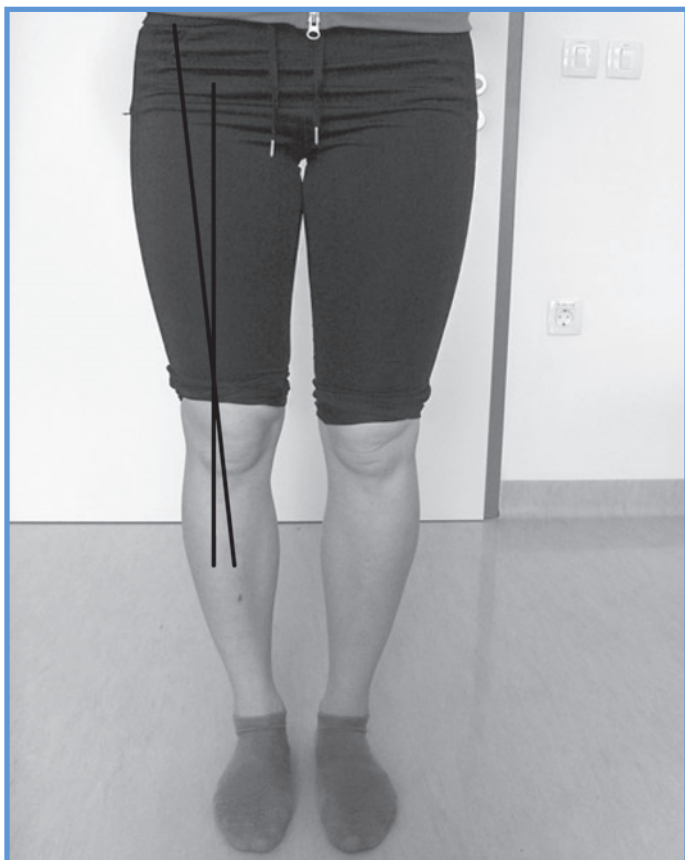
Slika 1: Statični kot-Q.

Sedaj je znano, da je statični kot-Q, ki pri ženskah v stoječem položaju meri 17^\circ , pri moških pa 15^\circ (12), pri obravnavi PFBS manj pomemben od dinamičnega kota-Q, ki ga merimo med funkcionalnim gibom – na primer med tekom, počepom ali doskokom. (3, 9) Dinamični kot-Q je namreč zaradi prevlade adduktornih in notranjih rotatornih mišic kolkov v funkciji – v primerjavi s statičnim kotom-Q – pri športnikih s PFBS navadno bistveno večji kot pri športnikih brez patelofemoralne bolečine (3, 9).