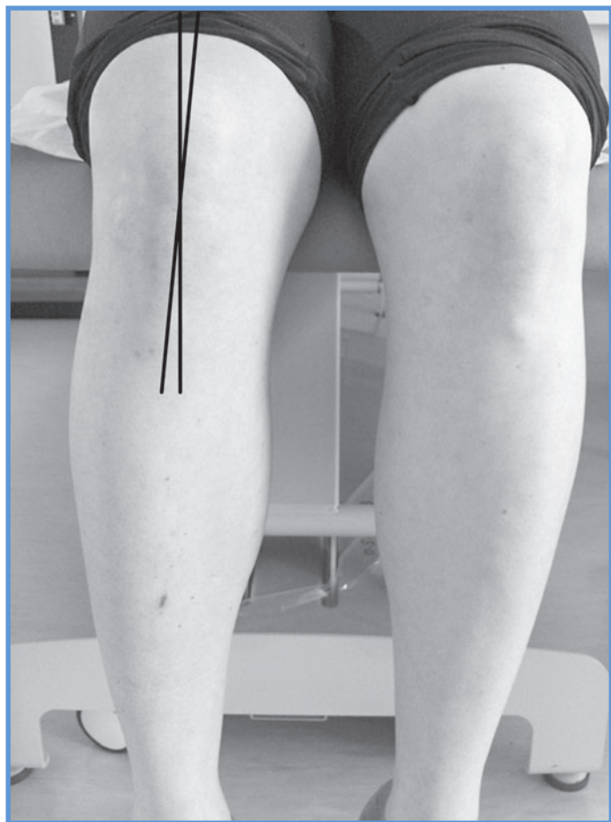
Slika 2: Kot sulcus - tuberositas .

Klinično pomembnost pri orientaciji ekstenzornega aparata pripisujemo tudi kotu sulcus -tuberositas (kot ST) med žlebom trohleje in golenično grčavino (slika 2), ki ga omejujeta premica skozi središče pogačice in središče golenične grčavine ter premica, ki teče pravokotno na transsepikondilarno os (12, 14). Kot ST običajno meri 0^\circ , patološke vrednosti presegajo 10^\circ , merimo pa ga pri pokrčenem kolenskem sklepu za 90^\circ (12,14).